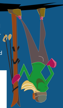
Foto: T. Prugnola, archivio foto Pejo - Grafica e illustrazione: STUO